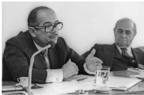
Galvêas com Tancredo: "Quem passou o governo para o Tancredo fui eu. Nós nos reunimos e eu passei tudo que tínhamos, os contratos, o acordo com o FMI", diz o ex-ministro

Para evitar o assédio da imprensa, Dornelles preferiu esperar o diretor-gerente do FMI retornar a Paris. "Tenho uma filha lá e vou visitá-la", explicou.